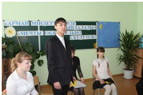
Стихотворение о Казахстане

Я стою на горе, Казахстан передо мной. Я смотрю, напрягая внимание и зрение, И не в силах я скрыть своего изумления Перед этой прекрасной, могучей страной.