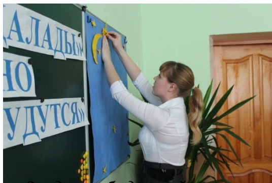
Звездное небо детской мечты