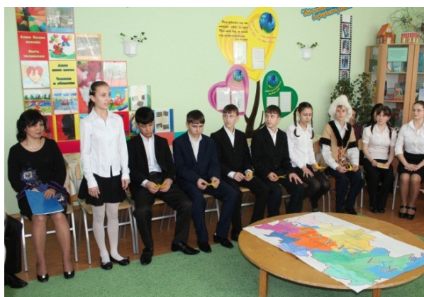
Стихотворение о Родине