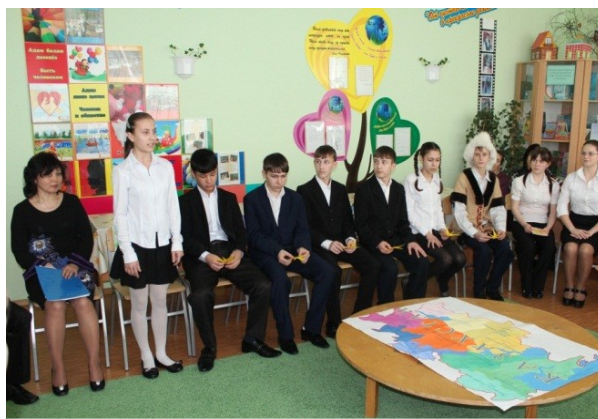
Стихотворение о Родине

«Біздің Қазақстан!» Алтай Жайық арасы – Жарты әлемдей даласы Ол біздің Қазақстан! Кенге толы койнауы, Төлге толы жайлаулы, Ол біздің Қазақстан! Жастан сүйіп аңсаған Тәтті күй мен кәусәр үн! Ол – біздің Қазақстан!