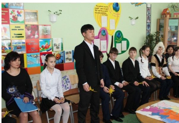
Стихотворение о Казахстане на казахском языке

Я стою на горе, Казахстан передо мной. Я смотрю, напрягая внимание и зрение, И не в силах я скрыть своего изумления Перед этой прекрасной, могучей страной.