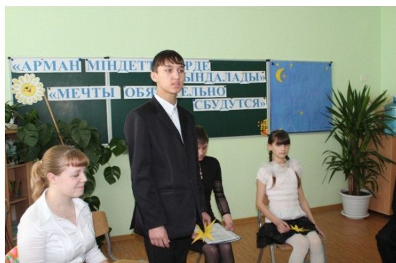
Стихотворение о Казахстане