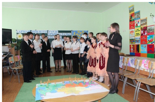
Музыкальный номер песня о Родине