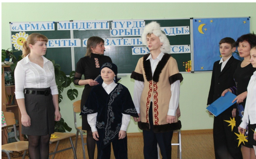
Фрагмент сценки «Старец и сын»

Жанарыңнан танқүліп жар болуға келіскен- Бақытым сың мәңгілік, аққуқанат періштем!